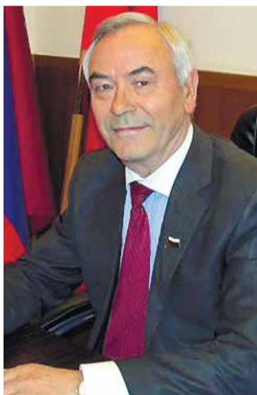
Уважаемые жители района!

Примите самые искренние поздравления с наступающими Новым годом и Рождеством Христовым! В эти праздничные зимние дни мы чувствуем особое тепло, потому что проводим их в кругу родных и близких.