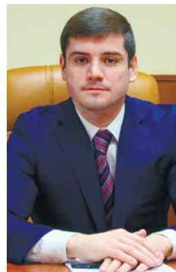
Дорогие жители района Фили-Давыдково!

Поздравляю Вас с наступающим Новым годом и светлым праздником Рождества Христова! Новый год — время новых надежд, успехов и побед. Самый любимый и добрый праздник, который с нетерпением ждут все: и взрослые, и дети. Он объединяет нас вокруг главных ценностей: любви к детям, к родителям, к своим близким. Это время, когда все мы вспоминаем самые яркие события года уходящего и загадываем желания.