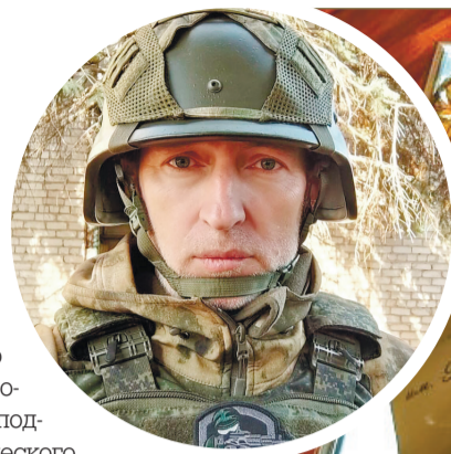
Пресс-служба хуторского казачьего общества «Филю-Давыдково»

лению Минобороны РФ он был награжден медалью ордена «За заслуги перед Отечеством» II степени за волонтерскую деятельность, а также «за самоотверженность, личный вклад в поддержку морально-психологического состояния и укрепление боевого духа участников СВО».