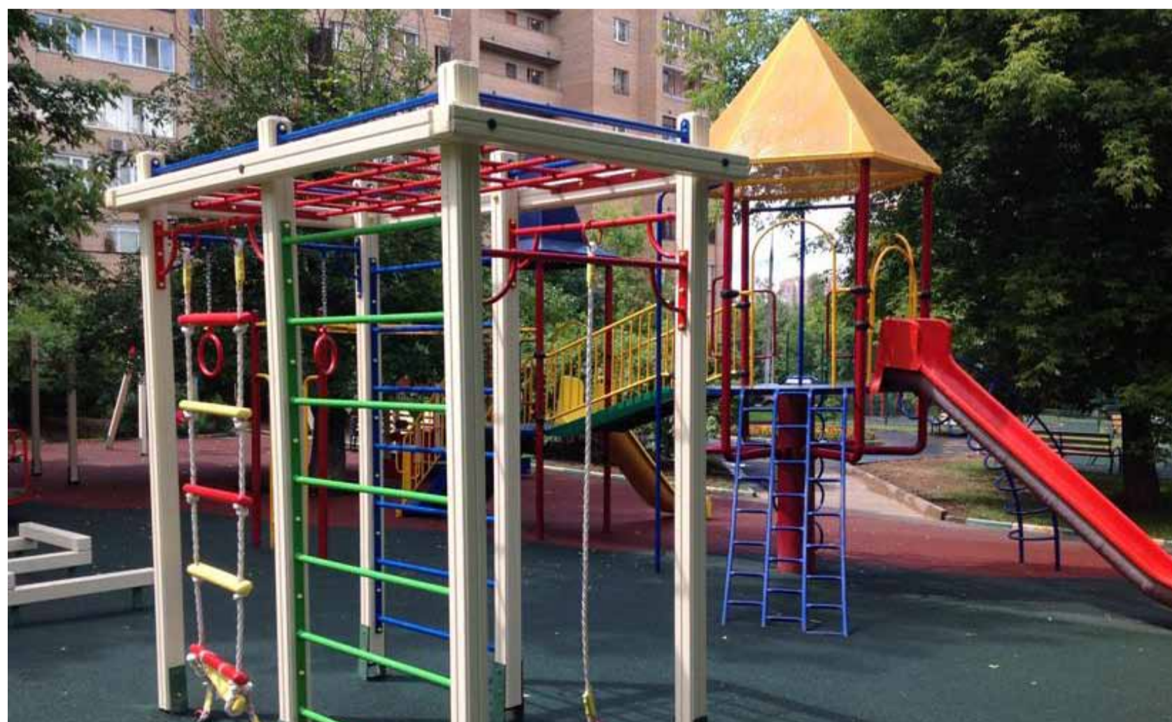
До проведения работ