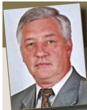
ВАЛЕНТИН ГОРБУНОВ, ГЛАВА МОСКОВСКОЙ ГОРОДСКОЙ ИЗБИРАТЕЛЬНОЙ КОМИССИИ

В честь запуска первых градостроительных референдумов все новые пользователи системы «Активный гражданин» могут получить дополнительные бонусные баллы по промо-коду STROIMOSRU. Ввести его можно на сайте проекта в разделе «Профиль».