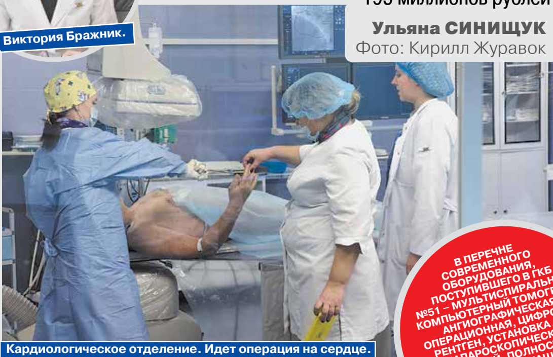
Кардиологическое отделение. Идет операция на сердце.

– Пожалуй, наиболее ярко эти изменения проявились при реализации сосудистой программы. До настоящего момента в последний раз изменения этой службы проводились в начале 60-х годов, когда были организованы первые блоки