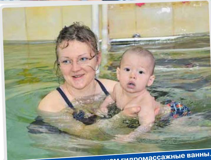
Особенно нравятся малышам гидромассажные ванны.

– А когда будет внедрена система электронной истории болезни пациента?